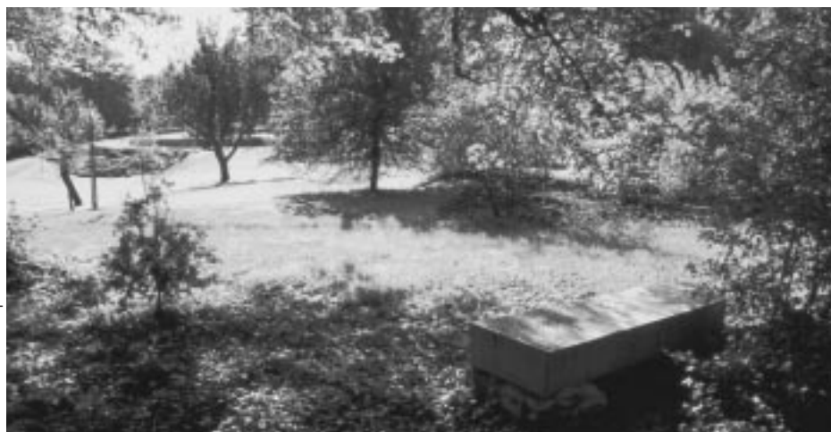
Barbirey-sur-Ouche (Côte-d'Or) : un jardin des XVIII e et XIX e siècle réhabilité.

Voir aussi la présentation du bureau des jardins et du patrimoine paysager et de la politique du ministère de la culture en faveur des parcs et jardins : http://www.culture.gouv.fr/culture/dapa/espacesproteges/index.html