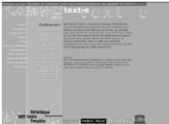
Page d'accueil du colloque virtuel text-e : http://www.text-e.org

Or, cette joute ne se déroulait pas sous forme orale et dans une sphère restreinte – comme c'est le cas dans un colloque traditionnel – mais par écrit et devant une audience virtuellement infinie, celle d'Inter-