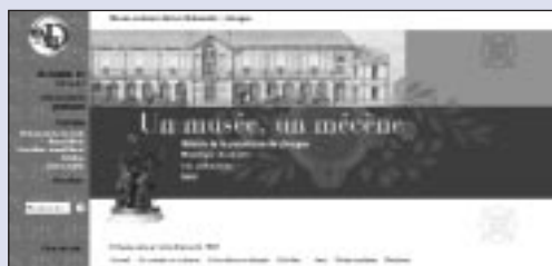
Musée national de la Porcelaine - Adrien Dubouché, Limoges : http://www.musee-adriendubouche.fr

Les conceptions et réalisations faisaient l'objet d'évaluations afin de proposer une offre mieux adaptée aux publics. Le but principal était de saisir le mode d'appropriation du contenu et la participation de l'utilisateur sur ces nouveaux supports.