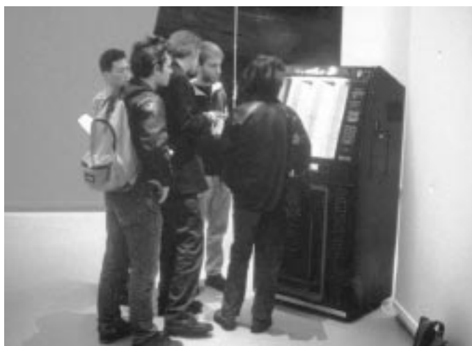
Collective JukeBox, 1996/2004.

Ces dispositifs sont devenus des espaces de création qui s'affirment, des espaces dans lesquels les singularités des pratiques s'enrichissent sans compétition. Les systèmes s'échangent, peuvent être « pluggés » les uns aux autres, ou l'un à l'autre, circulent à la disposition de chacun afin d'être augmentés, réutilisés, modifiés, activés ( Daemon 12 ), etc. Il s'agit bien aujourd'hui de favoriser la construction de situations collectives d'invention 13 – plutôt pollens que virus... –, hypothèse que nous pourrions formuler ainsi : « Quand