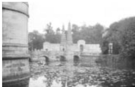
Domaine de Tanlay, Yonne (XVI e -XVII e s.).

qualitatifs (description des modalités de visites) et qualitatifs (attentes, motivations et satisfaction des visiteurs). Sont pris en compte le lieu, son territoire et son environnement d'une part, les visiteurs d'autre part. Ce projet prend appui sur la base de données Pausanias , qu'il