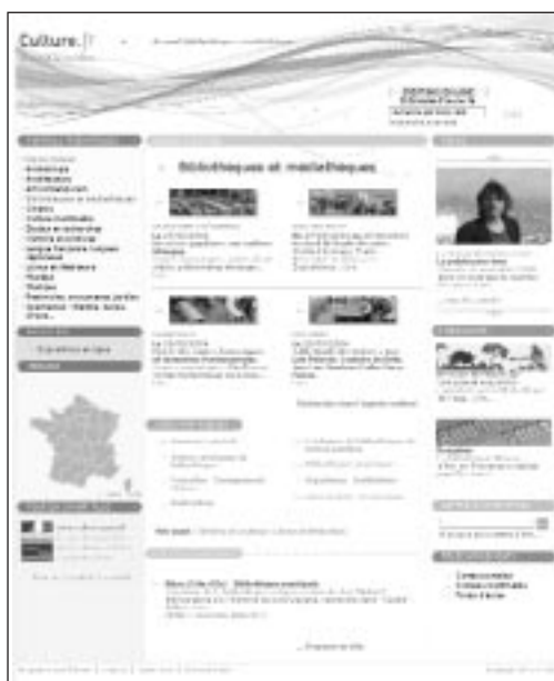
Page d'accueil des bibliothèques et médiathèques sur le portail Culture.fr : http://www.culture.fr/Groups/bibliotheques_et_mediathèques/home