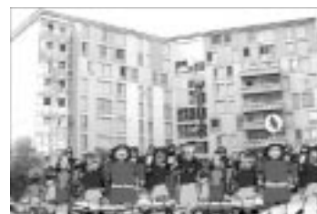
Images extraites de The Happy Case , un web cartoon réalisé par des jeunes des quartiers des Flamants et de la Belle de Mai, dans le cadre des ateliers multimédia de l'ECM la Friche la Belle de Mai. http://www.lafriche.org/thehappycase