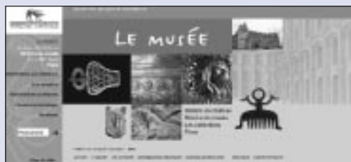
Musée des Antiquités nationales : http://www.musee-antiquitesnationales.fr

Dans le champ des nouvelles technologies, en raison des évolutions constantes, les recherches ont été plus développées du côté des techniques que des publics. Cependant, dès 1986, les musées scientifiques et techniques, en particulier la Cité des sciences et de l'industrie, menaient des évaluations sur le contenu des bornes interactives. À partir de 1993, la direction des musées de France (DMF) créait un comité d'experts pour aider les musées à la conception des bornes interactives dans les musées d'art et les musées d'histoire et la Réunion des musées nationaux (RMN) lançait les premiers cédéroms culturels.