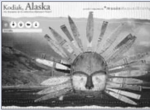
Écran d'accueil du mini-site de l'exposition « Kodiak, Alaska, Les masques de la collection d'Alphonse Pinart », musée du quai Branly : http://www.quaibrany.fr

motifs de visite d'un site de musée sont pluriels, sans lien nécessaire avec une visite du musée réel. Parmi les motifs n'ayant pas conduit à la visite du musée réel, les internautes citent la distance, le hasard du butinage. Les raisons qui les conduisent à visiter le musée réel peuvent être guidées par les informations découvertes sur le site : nouvelles expositions, musées méconnus d'une région, informations pratiques facilitant la visite et bien sûr désir de contact physique avec l'œuvre.