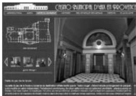
Visite de la salle du jeu de la boule.

photographique, complémentaire de celui déjà effectué par le service de l'Inventaire, pour réaliser une maquette numérique par photomodélisation. Des informations complémentaires ont également été tirées des quelques plans disponibles.