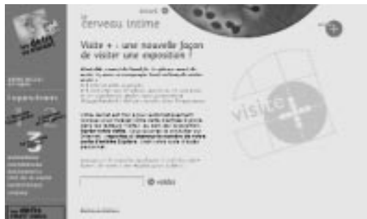
Page d'accueil de Visite+, dans le cadre de l'exposition « Le cerveau intime », Cité des sciences et de l'industrie, 22 oct. 2002, 31 août 2003. http://www.cite-sciences.fr/francais/ala_cite/expo/tempo/defis/cervint/

les musées scientifiques et techniques en lien avec des enjeux muséographiques et pédagogiques, mais dans les musées d'art, et plus largement dans les musées conservant un patrimoine que l'édition multimédia permettait de rendre accessible et de valoriser. Les études menées ont été sous-tendues par des questions sur la diffusion, par l'émergence et la structuration d'un marché de l'édition culturelle multimédia. Les études ont également poursuivi l'exploration des liens entre consultation des cédéroms culturels et pratique muséale. L'importance du contexte d'usage a été clairement établie, et plus particu-