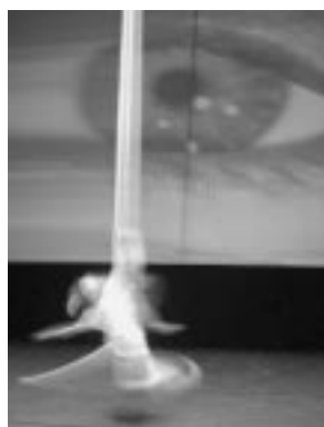
© Compagnie Nô / Herz - Cécile Guigny

Le DICREAM (dispositif pour la création artistique multi-média) est à la fois un système de coopération et de travail en réseau des huit grandes directions du ministère de la culture, et un fonds spécifique d'aide aux créateurs d'œuvres originales dans l'univers numérique, fonctionnant sur le modèle d'un guichet unique par l'intermédiaire du Centre national de la cinématographie.